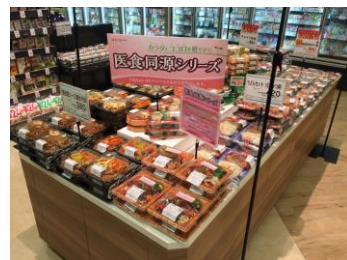
※売場イメージ(参考)